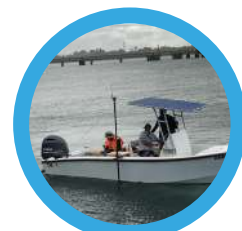
4 : Bathymétrie