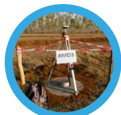
1 : Géodésie

Nos équipes de géomètre/topographe de terrain sauront répondre à vos besoins en agglomérations jusque dans les zones les plus reculées.