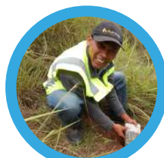
1 : Bornages

Nous assurons la sécurité des investissements de nos clients en évitant les conflits et litiges. Les services fournis vont au-delà de la simple mesure, ils sont garantis par le cadre légal du métier de Géomètre Expert à Madagascar.