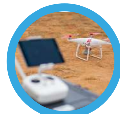
5 : Drone