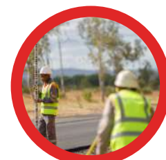
1 : Projets routiers

Notre équipe de projeteurs sera répondre à vos besoins sur tous types de projets : terrassements, routiers, miniers, ferroviaires et VRD.