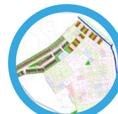
2 : Délimitations