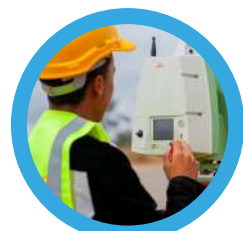
3 : Scanner laser