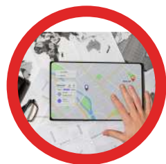
1 : WEB SIG

Notre savoir-faire assure à nos clients la prise de décisions éclairées, l'augmentation de leur productivité, l'amélioration de la gestion de leur patrimoine, l'optimisation des coûts et contribue à la réduction des impacts environnementaux. GEOMAP joue un rôle essentiel dans le développement de la ville intelligente et durable de demain (SmartCity) via l'exploitation des données géographiques.