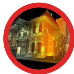
2 : Modélisation 3D