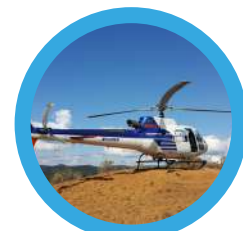
6 : Lidar