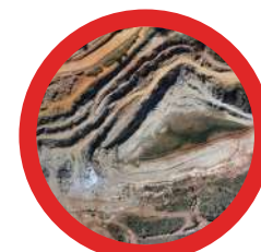
2 : Cubatures