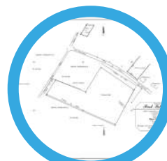
3 : Parcellaire