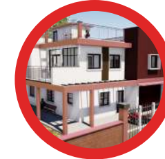
4 : Bâtiments